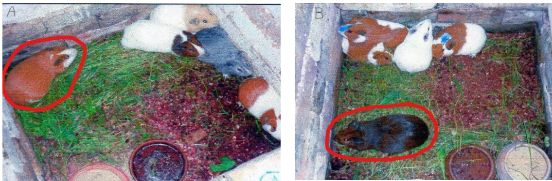
Figura 1. Empadre de cuyes en pozas con un macho reproductor (encerrado con líneas rojas) y cuatro hembras. A) Macho mejorado con hembras nativas F2. B) Macho nativo F2 con hembras mejoradas

alimento concentrado a razón de 30 g/hembra/día, durante toda la lactación.